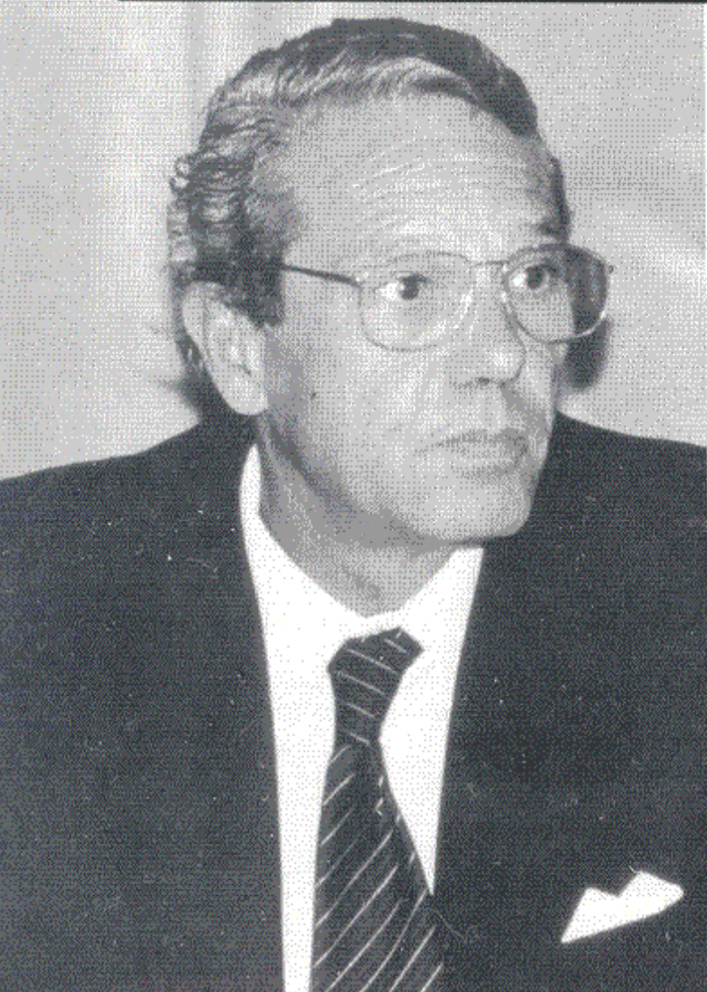
JOAQUIM NAVARRO-VALLS: MÉDECIN, ANALYSTE, JOURNALISTE. CE QUI ÉTAIT SON TRAVAIL, LA MÉDECINE, DEVIENT SON HOBBY; ET CE QUI ÉTAIT SON HOBBY, L'ÉCRITURE, DEVIENT SON TRAVAIL.

avant tout l'optimisme, «c'est-à-dire voir et vivre les problèmes dans une dimension positive».